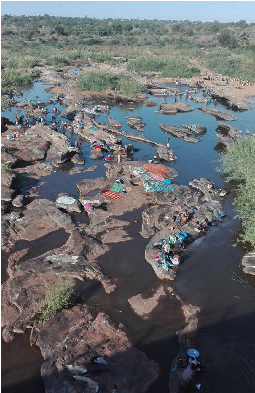
Corridoio di Nacala, Mozambico

I fondi sono stanziati nella delibera n. 146 del 16 dicembre 2021: ossia quel «contributo a dono pari a 3 milioni di euro per l'assistenza tecnica all'iniziativa in questione».