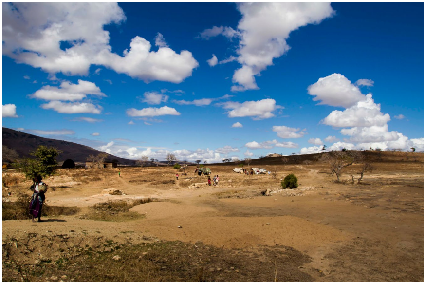
La savana desertificata in Mozambico.

agricole), ma non è stata ad oggi coinvolta nel CAAM.