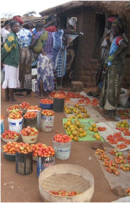
Mercato nella provincia di Manica. Foto Ton Rulkens, Mozambique, Flickr, CC BY-SA 2.0

«Il governo del Mozambico ha avviato una campagna con partner internazionali per il risanamento delle infrastrutture e del tessuto sociale colpito dal ciclone Idai – si legge nel testo del CAAM - e ha richiesto l'intervento dell'AICS per la ricostruzione del mercato agroalimentare nel comune di Chimoio».