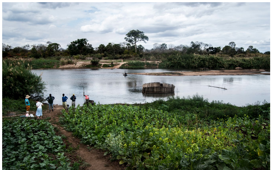
Mozambico, confine tra Nampula e Niassa.

La genesi del Piano Mattei si può far risalire ai primi giorni dell’invasione dell’Ucraina da parte della Federazione russa, quando si è compresa la portata della dipendenza europea dalla produzione di idrocarburi in altri paesi. Le risposte istituzionali alla conseguente crisi energetica hanno “spinto” numerosi stati europei, Italia compresa, da una dipendenza a un’altra. Nella prima-