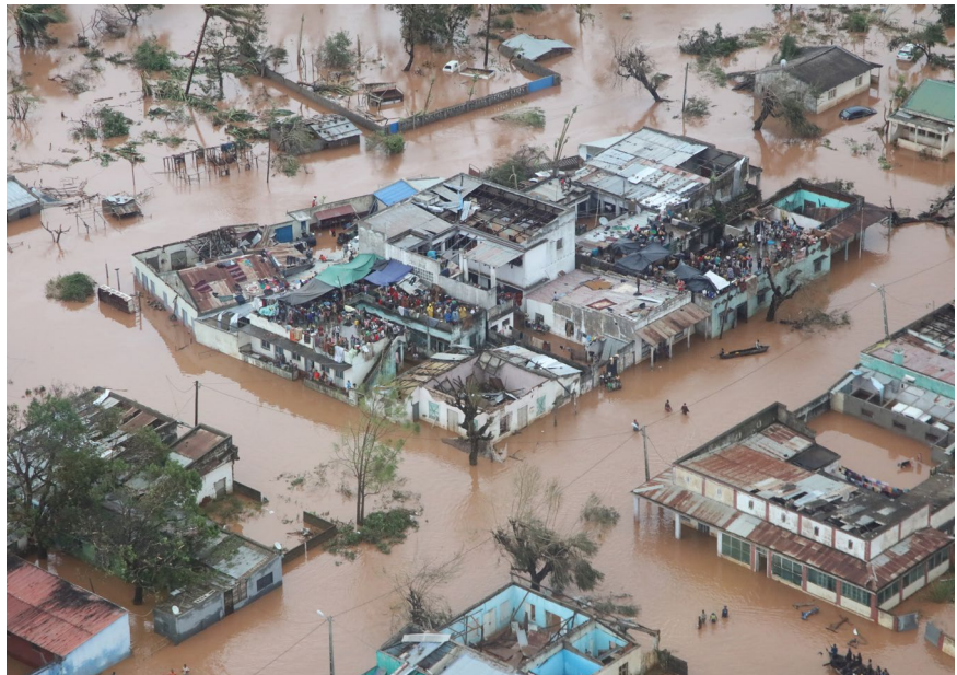
Abitanti si rifugiano sui tetti degli edifici in seguito alle inondazioni causate dal ciclone Idai in Mozambico. Marzo 2019.

L'attenzione delle agenzie di cooperazione, delle Nazioni unite e dei donatori si riposiziona su un territorio che ha un potenziale, e che in precedenza era stato al centro degli appetiti internazionali grazie alla creazione nel 2009 del Beira Agricultural Growth Corridor. La forza distruttiva del ciclone tropicale di categoria 4 ha causato lo sfollamento di oltre 19mila nuclei famigliari e 95mila persone per l'81% residenti nelle province di Sofala e Manica. Oltre 715mila ettari di raccolto sono andati perduti e 598 persone hanno perso la vita. «Stiamo ancora quantificando i danni», denunciavano nell'immediato i piccoli imprenditori della zona. «È stato uno dei cicloni peggiori mai registrati nell'emisfero meridionale – scriveva in un report