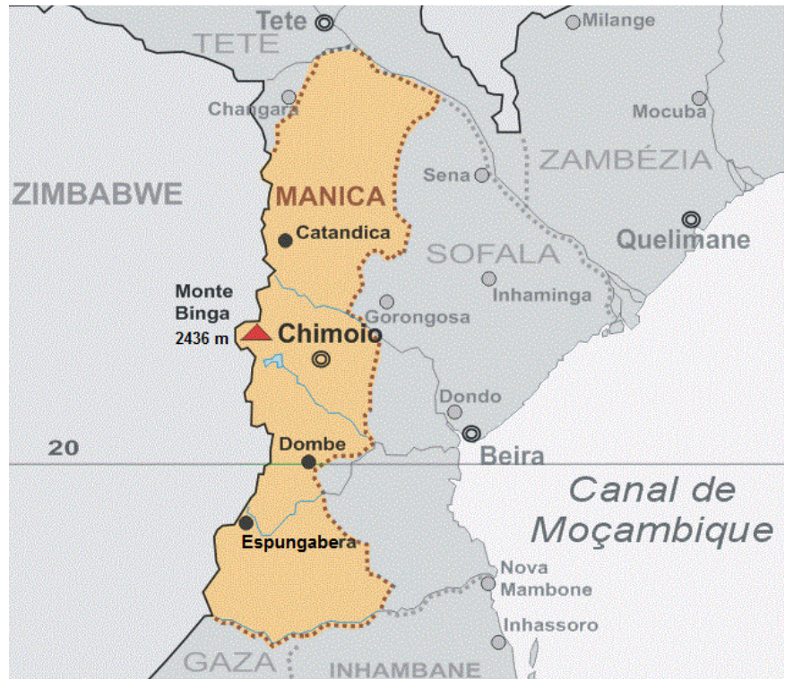
Mapa delle provincia di Manica in Mozambico.

rebbero scartati e sprecati, perché troppo maturi o non conformi». Si fa poi riferimento all'imballaggio di prodotti tagliati e lavati, «confezionati in vassoi e pronti per essere spediti all'esportazione o verso altre destinazioni nel Paese». Si specifica che «il modello italiano può essere opportunamente adattato alla realtà mozambicana e costituisce il punto di partenza».