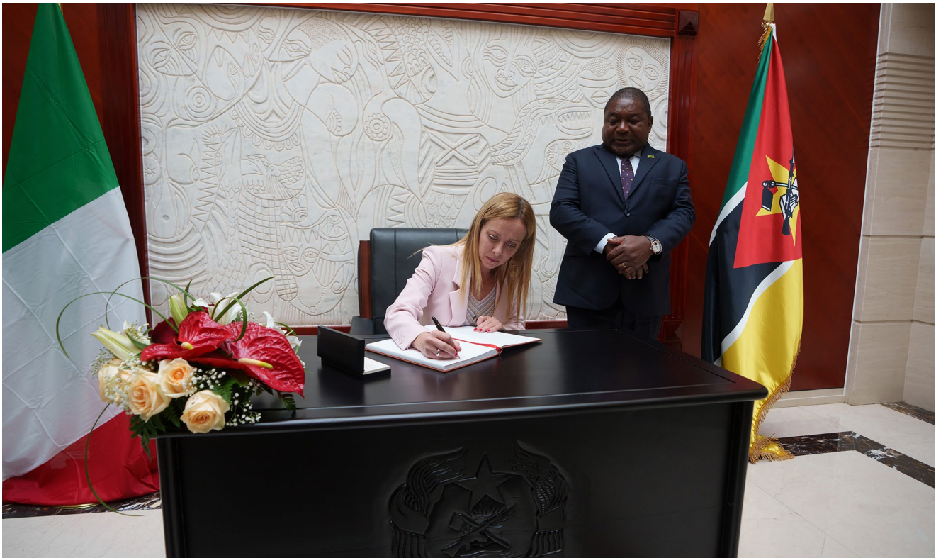
Maputo, 13/10/2023 - La Presidente del Consiglio, Giorgia Meloni, con il Presidente della Repubblica del Mozambico, Filipe Nyusi.

tuali proposte dai concorrenti e non sul criterio del prezzo più basso». Per quanto riguarda gli stipendi ai nostri funzionari, «i costi corrispondenti al compenso del rappresentante italiano e parte delle risorse umane dedicate alla Unità di Gestione (UG) saranno addebitati al fondo, gestito direttamente da AICS».