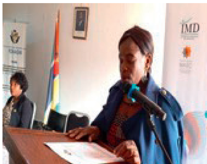
Directora Executiva do Fórum das organizações da Sociedade Civil (FONAGNI) e Coordenadora do Núcleo Provincial da Rede Moçambicana dos Defensores de Direitos Humanos na província do Niassa

Martins destacou que se tornava imperioso que